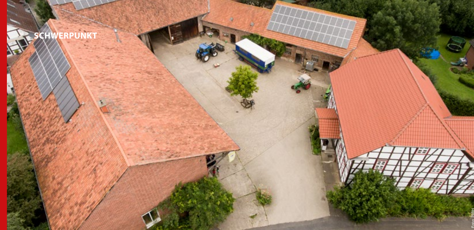
Die alte Hofanlage, in der die Bildungseinrichtung angesiedelt ist, von oben.