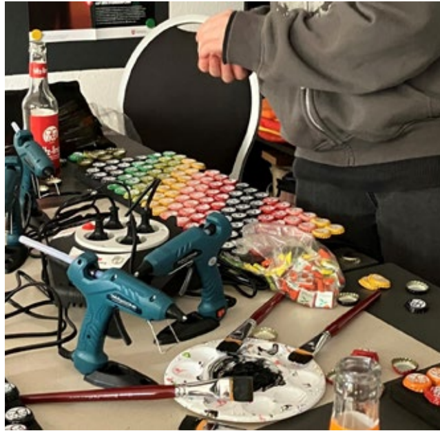
Ein Ergebnis des Workshops zum Thema Fairtrade war dieses Kronkorkenmosaik, hergestellt aus bereits vorhandenen Materialien mit dem Lerneffekt: Man muss nicht immer Neues kaufen.

Um eine fachgerechte Beratung zu dem Thema „Minimierung der Folgen des Klimawandels für Einrichtungen“ zu erhalten, haben wir einen Antrag bei dem Förderprogramm der Zukunft-Umwelt-Gesellschaft gestellt, in dessen Folge die Förderrichtlinie „Klimaanpassung in sozialen Einrichtungen“ (AnpaSo) aufgesetzt wurde. Hier geht es um Baumaßnahmen (bevorzugt „grüne“), um die Auswirkungen des Klimawandels so gering